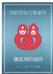
消防団協力事業所表示証

「消防団協力事業所」として認められた事業所は、取得した表示証を社屋に掲示でき、表示証のマークを自社ホームページなどで広く公表することができます。