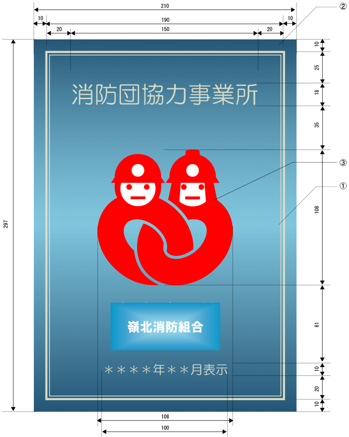
様式第2号（第6条関係）